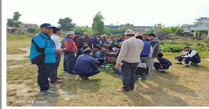
मेशिनरी औजार उपकरण मर्मत तथा सम्भार तालिममा प्रयोगात्मक सिप सिकाउदै