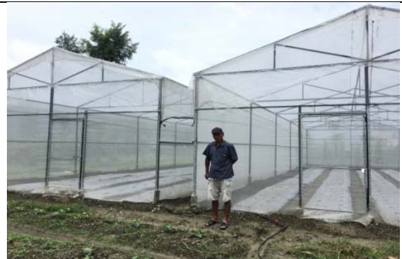
पोखरा म.न.पा. १४ मा निर्मित स्थायी प्लाष्टिक घर