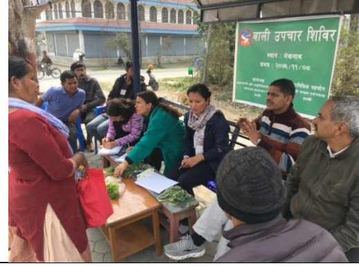
स्थलगत प्रयोगशाला सेवा ण माटो तथा बाली संरक्ष) (शिविर