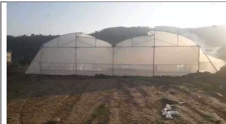
पोखरा म.न.पा. १९ पुरनचौरमा निर्मित सेमी हाइटेक ग्रीन